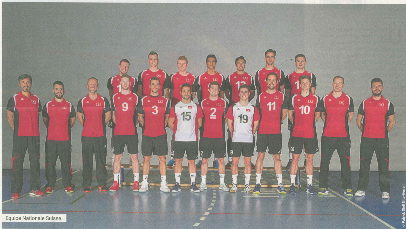
Equipe Nationale Suisse.

DEPUIS 1968 SPOTVISION TV - VIDEO - HIFI LOCATION - VENTE DEPANNAGE Antennes, Vidéo- Surveillance, IPTV 022 348 11 48 www.spotvision.ch